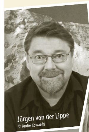
Jürgen von der Lippe