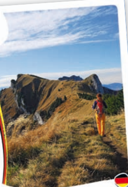
Benediktenwand, 1800 m